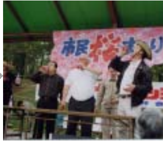
5月12日 市民桜まつり参加