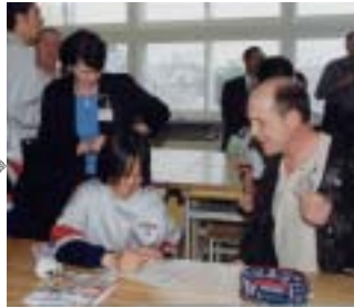
5月13日 一已中学校視察