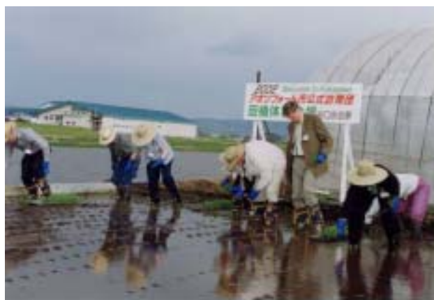
↑ アボツフォード市公式訪問団 田植え体験

本誌は、(財)自治総合センターから宝くじ普及広報事業費の助成を受けて作成されたものです。