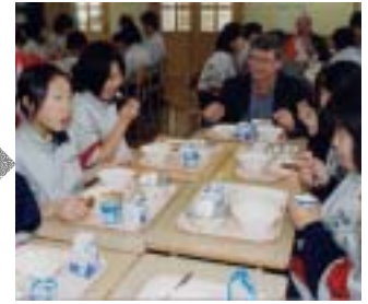
5月13日 学校給食試食