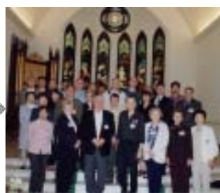
5月11日 聖マーガレット教会視察