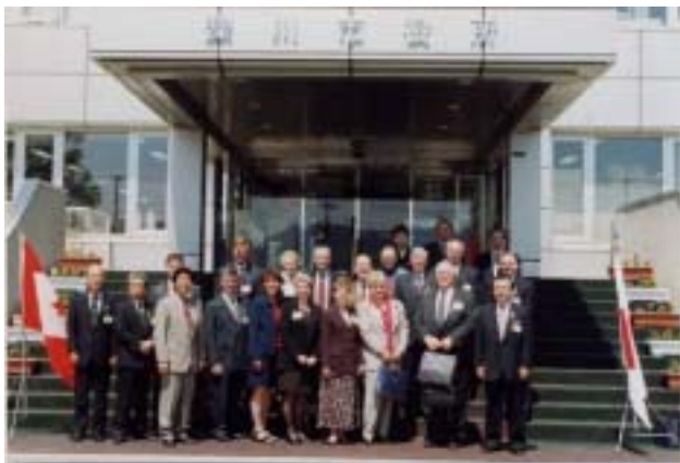
↑ アボツフォード市公式訪問団 深川市役所にて記念写真