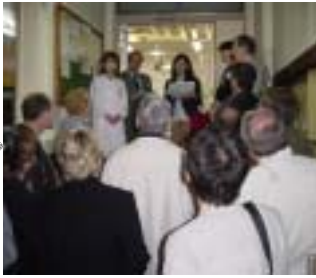
5月13日 給食センター視察