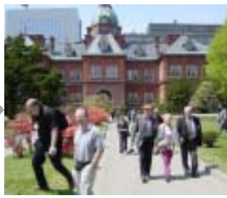
5月14日 札幌市内観光