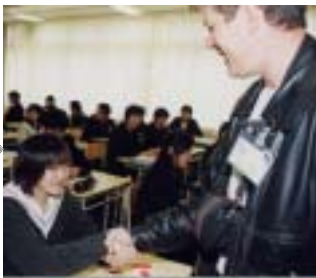
5月13日 深川西高等学校視察