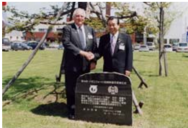
↑ 姉妹都市記念碑除幕式