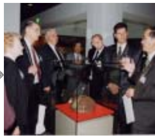
5月10日 生きがい文化センター視察