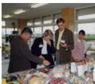
5月11日 ほっと館ふぁーむ見学