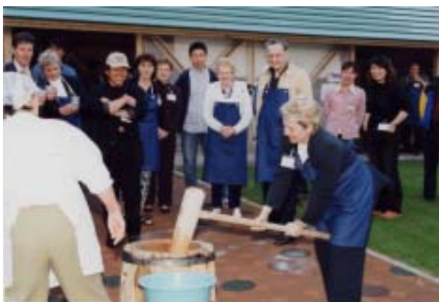
↑ アボツフォード市公式訪問団 深川国際交流協会主催歓迎会