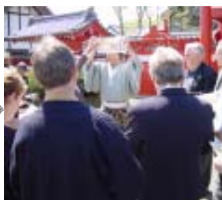
5月15日 登別伊達時代村見学