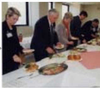
5月10日 拓殖大学道短大歓迎交流会