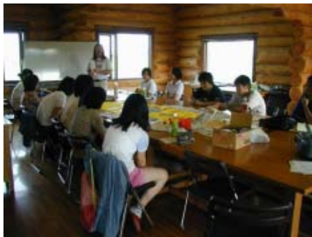
英会話のレッスン