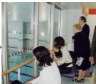
5月10日 温水プール視察