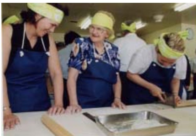
↑ アボツフォード市公式訪問団 そば打ち体験