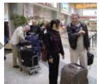
5月15日 新千歳空港出発 ~ departure