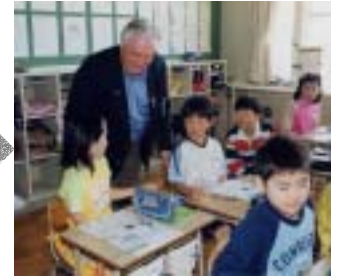
5月13日 深川小学校視察