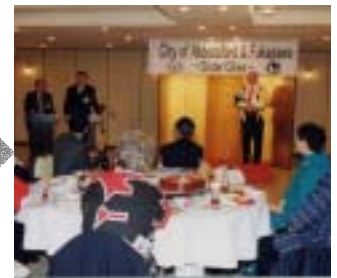
5月13日 アボツフォート市主催 返礼夕食会