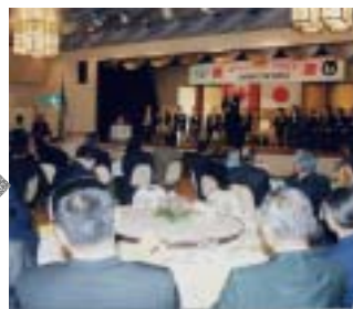
5月10日 深川市主催歓迎夕食会