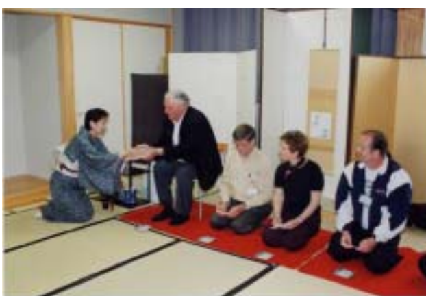
↑ アボツフォード市公式訪問団 茶道体験