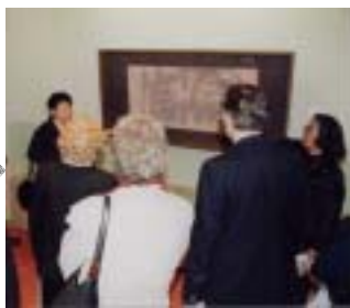
5月10日 アートホール東洲館視察