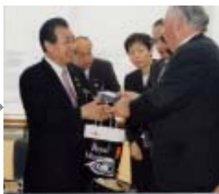
5月10日 市長表敬訪問