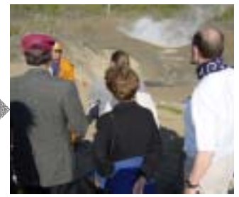
5月14日 有珠山(西山火口群)見学