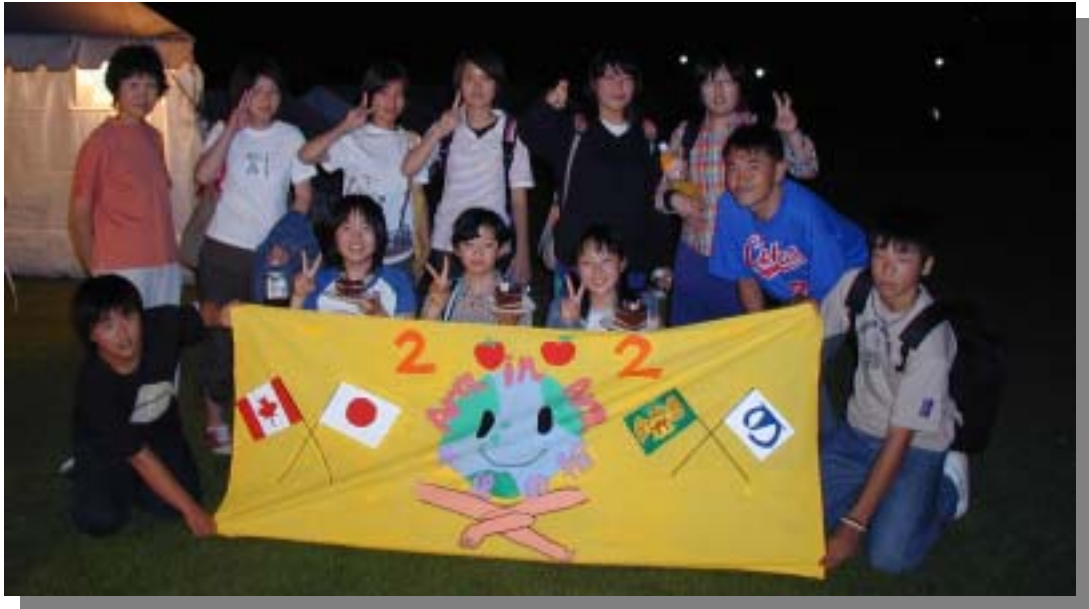
完成した横断幕を囲んで、ハイッ！チーズ（青少年カナダ交流訪問団事前研修）