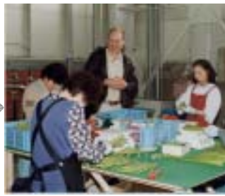
5月13日 野菜集出荷施設視察