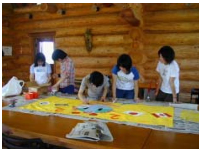
カナダに持っていく横断幕を作成