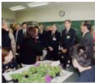
5月10日 拓殖大学道短大訪問