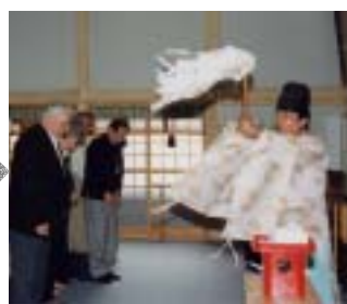
5月12日 大國神社視察