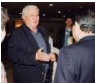
5月9日 深川市着 ~ arrive